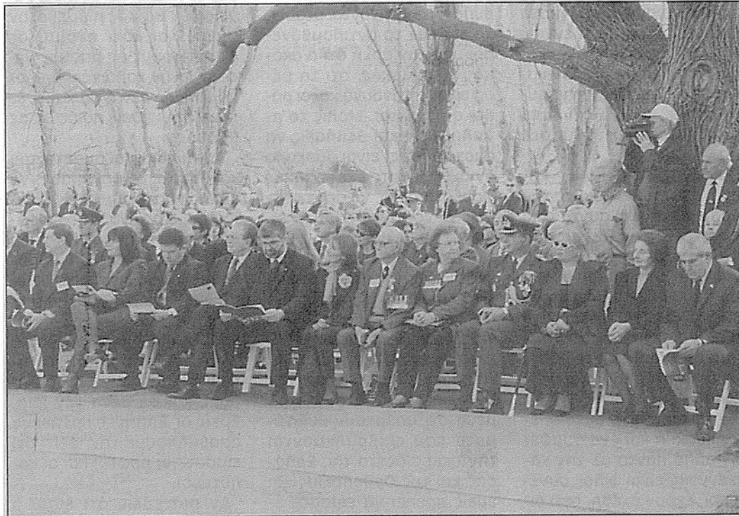
Μερικοί από τους προσκεκλημένους, πολιτικοί, στρατιωτικοί, απόστρατοι και κοινοτικοί παράγοντες στο χώρο του Μνημείου.